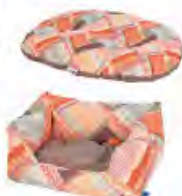
L'Isola dei Tesori PETUP CUSCINO OVALE E CUCCIA RELAX

Hurttà Italia lancia la versione Eco di Outback Dreamer. Innovativa cuccia-sacca a pelo, con materiale riciclato al 100% da bottiglie di plastica. Al design innovativo che caratterizza Outback Dreamer, progettato per garantire un riposo caldo e confortevole al cane in viaggio, in campeggio, nelle escursioni o nelle pause dalle attività sportive, si aggiunge l'attenzione per l'ambiente. www.hurttà.it