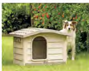
Bama CUCCIA BUNGALOW