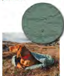
Hurttà Italia CUCCIA-SACCO A PELO

Raggio di Sole ha ideato le cuccette imbottite ovali Terrier della linea SunRay per gatti e cani di taglia piccola e media (tre misure e vasto assortimento colori). Tutte made in Italy vantano cura artigianale nei dettagli, tessuti morbidi, resistenti e pratici per il lavaggio. In tessuto misto cotone/poliestere dalla simpatica fantasia con cagnolini e cuori, con fondo in nylon antiscivolo e cuscino imbottito estraibile e sfilabile double face. www.raggiolisole.it