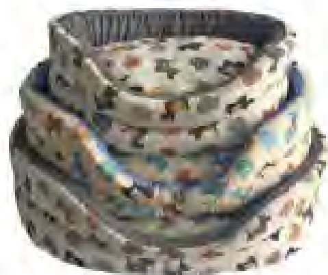
Cargill CUCCIE TERRIER

Due prodotti esclusivi L'Isola dei Tesori, entrambi disponibili in diverse fantasie e dimensioni. Petup cuscino ovale , morbido e in tessuto lavabile a 30°, Petup cuccia Relax , soffice, per cani, in tessuto ovatta, 100% poliestere. www.isoladetesori.it