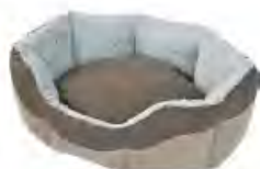
Maxi Zoo CUCCETTA ANIONE LETTO PETIT FRIEND

Cuccia in trama beige, versione (80x56x21 e 110x94x77) con base estraibile per una pulizia più comoda e tetto regolabile in due posizioni per una migliore aerazione, disponibile nel nuovo formato large, per cani di grossa taglia. Facile e veloce da assemblare grazie al semplice sistema a incazzo. Realizzata con materie di prima scelta, 100% riciclabili e adizionate di anti Uv per non scolorire al sole. www.bamagroup.com