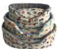
Cargill CUCCIE TERRIER

La cuccetta Anione Letto Petit Friend, dal design moderno e con fondo antiscivolo, è dotata di un cuscino reversibile e removibile. Adatta a gatti o a cani di piccola taglia, di dimensione di cm 62x40x10, vanta cuscini lavabili a 30°, mentre la cuccia va lavata a mano. www.maxizoo.it